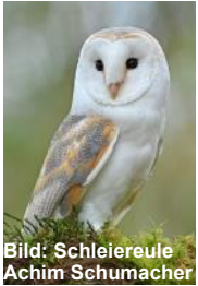
Bild: Schleiereule

Mitte der 1960er Jahre lebten noch dreißig oder vierzig Uhu-paare in Deutschland, heute sind es mehr als dreitausend. Der Uhu – Europas größte Eulenart – ist zurück, aber nicht außer Gefahr.