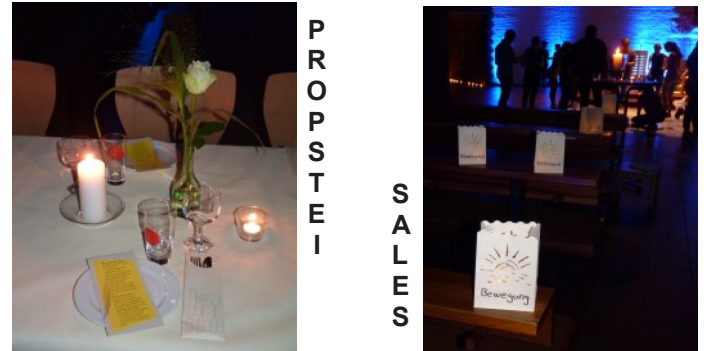
„Suchen, was uns antreibt“, Jugendkirche Sales