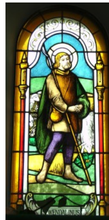
St. Wendelinus

Herzliche Einladung zum Wendelinusfest am Sonntag, den 16.10., um 15.00 Uhr zur Wendelinuskapelle, Wolfshovener Str., am Ortsausgang Stetternich Richtung Hambach.