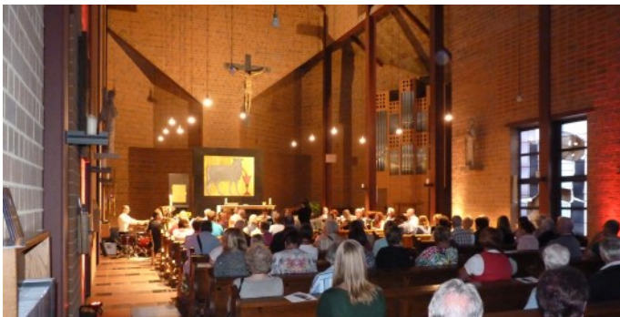
„Voll das Leben - Sehnsucht nach mehr“, Barmen