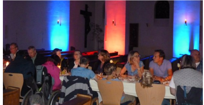
„Sehnsucht nach Gemeinschaft“, Propsteikirche