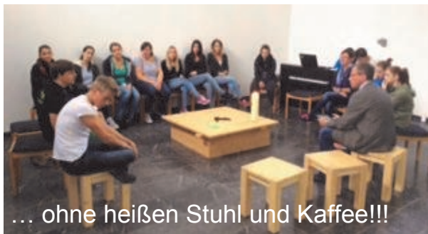
... ohne heißen Stuhl und Kaffee!!!