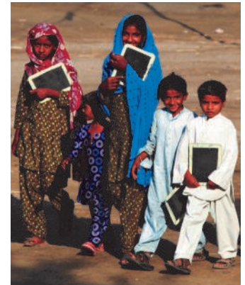
Christliche Schulkinder in Pakistan auf dem Weg zur Schule.