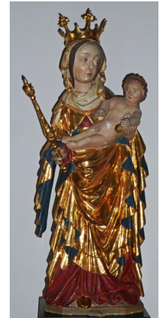
Spalter Madonna von 1519, St. Emmeran, Spalt (Bayern)

Sei begrüßt, Königin, Mutter der Barmherzigkeit, unser Leben, unsre Wonne und Hoffnung, sei begrüßt! (aus dem „Salve regina“)