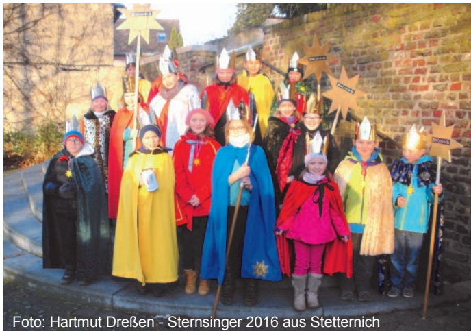
Sternsinger 2016 aus Stetternich

Auch in diesem Jahr waren in den Gemeinden der Pfarrei die Sternsinger und Sternsingerinnen mit ihren Begleitungen wieder sehr aktiv. Insgesamt wurde ein tolles Sammelergebnis von fast 32.000€ eingeholt, das notleidenden Kindern in der ganzen Welt zu Gute kommt. Ein herzliches „Vergelt's Gott!“ gilt allen Spendern und Unterstützern dieser Aktion von Kindern für Kinder!