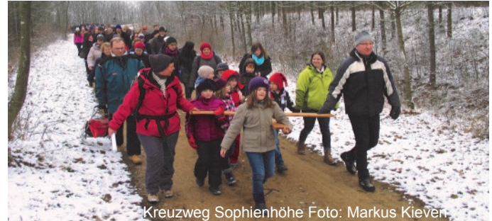
Kreuzweg Sophienhöhe

16.30 Uhr: Abendmahlfeier für Kinder in St. Martinus (Barmen)