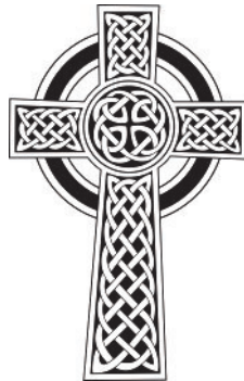
Grafik: Celtic cross, Petr Vodicka_gemeinfrei

Übrigens ist eine Erklärung für die Entstehung des Irischen (Keltischen) Kreuzes die Idee, dass der Kranz um den Kreuzungspunkt die Sonne symbolisieren soll: Hinter aller Grausamkeit und jenseits des Todes sehen die Iren immer schon die Sonne aufgehen.