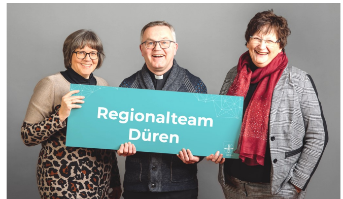
Text: Kommunikationsabteilung