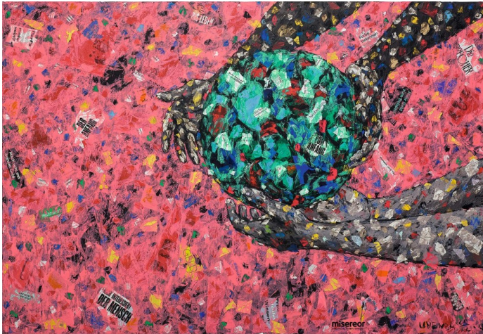
Das Misereor-Hungertuch 2023 „Was ist uns heilig?“ von Emeka Udemba.

Klima, Kriege, Pandemien: Die komplexen Multikrisen unserer Tage führen uns vor Augen, wo die Schwachstellen unserer politischen, wirtschaftlichen und gesellschaftlichen Strukturen liegen. Auch wenn Krisen immer verzahnter werden und sich gegenseitig verstärken, ist und bleibt die Klimaveränderung die fundamentale Frage unseres Überlebens.